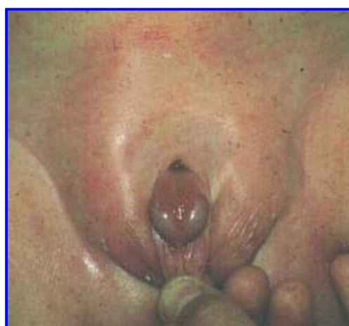
Fig. 3: Epispadia sottopubica