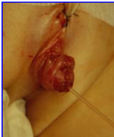
Fig. 8: Ricostruzione dell'uretra risultato