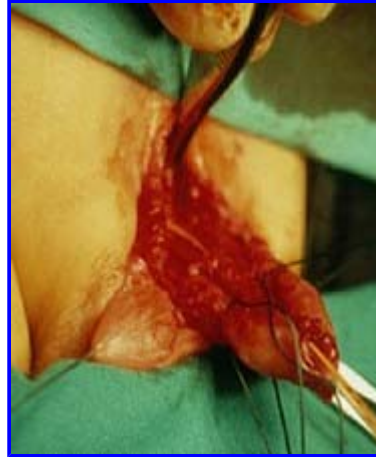
Fig. 7: Ricostruzione dell'uretra