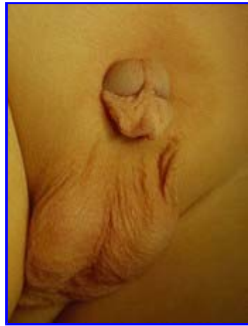
Fig. 1: Epispadia