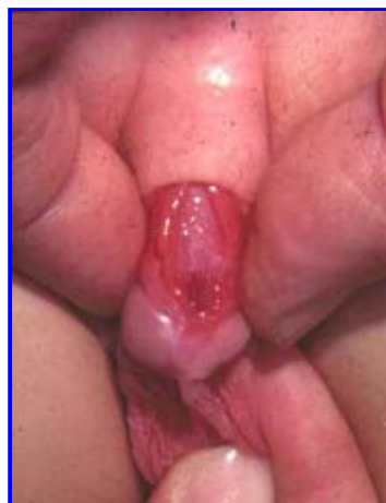
Fig. 2: Epispadia peniena